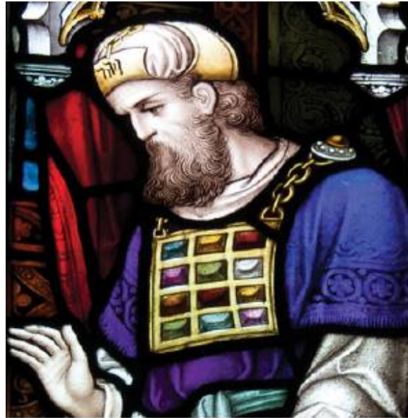
הכהן הגדול עם "האורים והתומים"

"כשאני מספר לאנשים שאני ד"ר לגורלות, אנשים לעיתים מרימים גבה או צוחקים, אבל אחרי כמה דקות שיחה אני מוצא אותם נפעמים ומביעים עניין רב בנושא. גם המחקר שלי התקבל