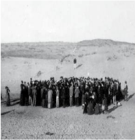
הגרת מגרשים בת"א, 1909